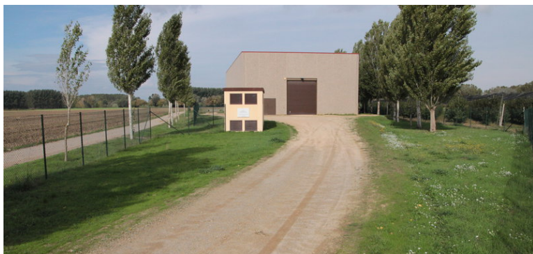
L'estació de tractament d'aigua potable (ETAP) de Fontanilles, que subministra aigua del Baix Ter a la Bisbal i Forallac des de finals del 2007