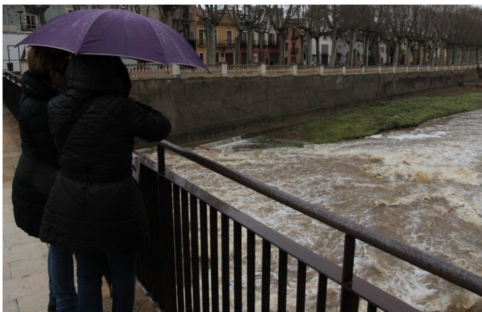
Els estralls de la forta gregalada