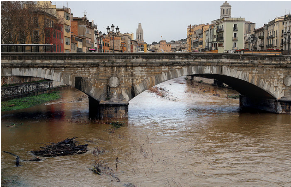
Els estralls de la forta gregalada