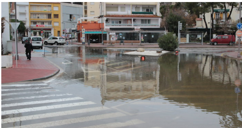
Els estralls de la forta gregalada