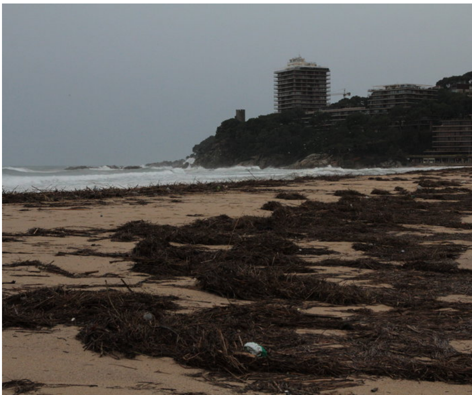
Els estralls de la forta gregalada