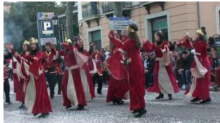
Carnavals en plena Quaresma a Olot i l'Empordà

Milers de persones van sortir ahir als carrers de diverses poblacions de les comarques gironines per desfilars en les que ja són les últimes rues de Carnaval d'aquest any. Malgrat que ja estem en plena Quaresma, això no ha estat impediment perquè la diversió i la disbauxa continuïn essent les protagonistes d'aquesta festa.