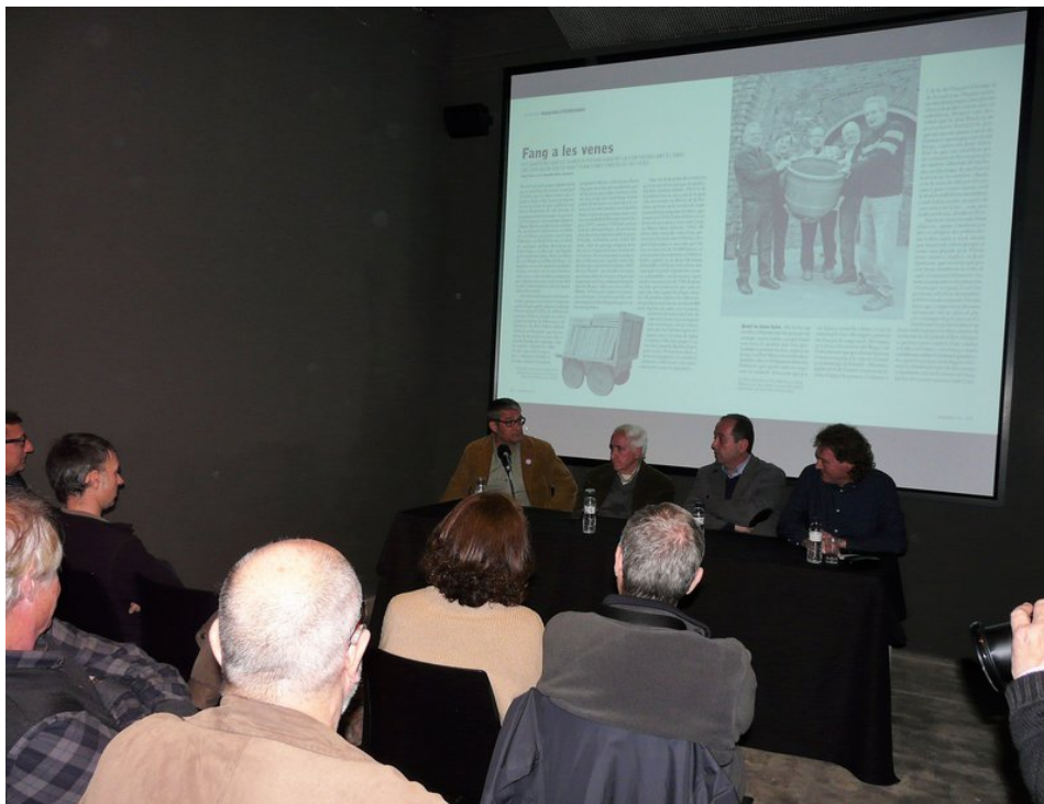
L'acte de presentació de la revista, divendres