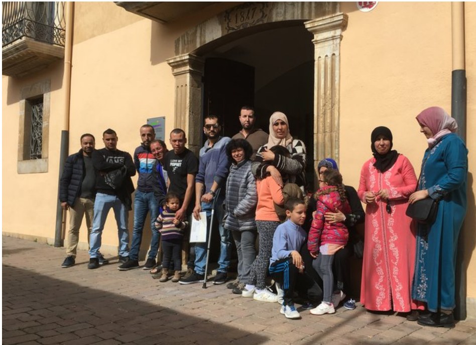
Alguns dels veïns afectats, ahir, davant el Consell Comarcal del Baix Empordà.