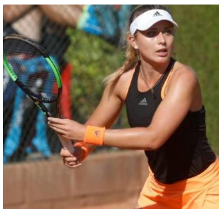
Paula Badosa. aniol resclosa

El torneig de la Bisbal es tancarà demà amb la disputa de la gran final. La prova, inclosa al circuit ITF, ha incrementat aquest any la dotació de premis, repartint en total 25.000 dòlars (uns 23.000 euros).