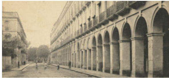
Un viatger a la Bisbal del 1890