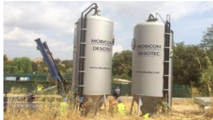
Els filtres de carbó actiu, que depuren 100 metres cúbics d'aigua

La crisi de l'aigua a la Bisbal i Forallac es va desencadenar el 4 d'agost quan els dos ajuntaments van dictar un ban on comunicaven que l'aigua no era apta per beure ni cuinar -sí per altres usos com regar plantes o rentar estris de cuina- per contaminació d'herbicides. Concretament, després que l'analítica dels pous del Daró donés un excés de concentració de diuró i terbutilazina, es va procedir a fer-ne'n una altra, ara procedent de l'aigua de l'aixeta, que va posar de manifest un resultat excessiu d'acord amb la normativa estatal: 0,19 micrograms per litre de diuró i 0,53 de terbutilazina. Davant d'aquesta situació i la declaració de l'aigua com a no apta per beure ni cuinar, l'Ajuntament de la Bisbal va convocar una