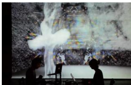
El Terracotta acull la inauguració i la cloenda del II Empordà Fang Cuit

El Terracotta Museu de la Bisbal d'Empordà torna a col·laborar enguany amb les jornades ceràmiques Empordà Fang Cuit. En aquesta segona edició hi haurà una participació més alta del museu, que esdevindrà l'espai d'inauguració, amb l'acollida dels alumnes i una xerrada a càrrec de Claudi Casanovas; i el de cloenda, amb una Nit d'Estiu al Terracotta carregada d'activitats.