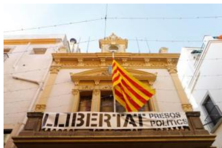
L'Ajuntament de Palamós, on només hi ha la Senyera hissada el 27 d'octubre, quan el Parlament català va proclamar la República