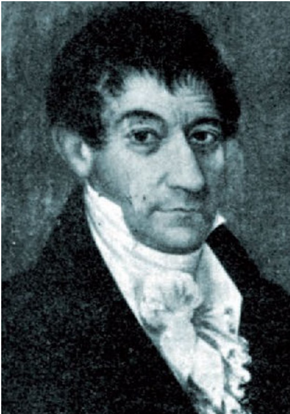
Un quadre de Ribó va representar O'Donnell durant el setge de la Bisbal Foto: AJUNTAMENT DE LA BISBAL.