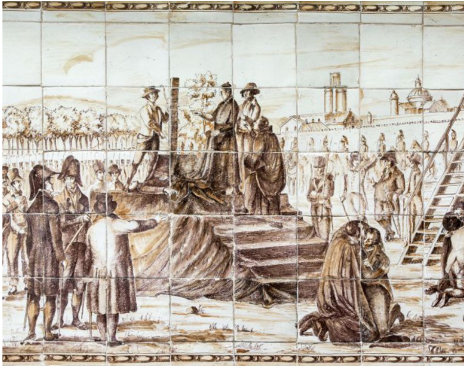
A l'esquerra, gravat que representa l'entrada dels francesos a Barcelona el 1808; a la dreta, fragment del panell ceràmic, a la plaça Garriga i Bachs de Barcelona