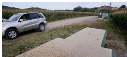
Els pous de la Bisbal no fan net de l'herbicida que contamina l'aigua

L'aigua dels pous que abasteixen els municipis de la Bisbal d'Empordà i Forallac no fa net de la presència en excés d'un herbicida, el carbendazim, que en l'anàlítica d'aquest mes de desembre torna a superar, per poc, el límit legal que estableix la normativa espanyola.