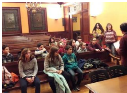
El Consell d'Infants de la Bisbal decidirà on invertir 5.000 euros la bisbal d'empordà

Introduir els més menuts als processos participatius, comprendre les diferents sensibilitats i acostumar-los al debat respectuós i plural. Amb aquest rerefons pedagògic i amb l'objectiu d'escoltar i efectuar les seves propostes, l'Ajuntament de la Bisbal ha decidit destinar 5.000 euros del procés participatiu per invertir en el que esculli el Consell Infantil Municipal de la Bisbal (CIM). En aquest sentit, els membres del CIM ja han protagonitzat una trobada amb l'equip de govern per anar treballant en les propostes.