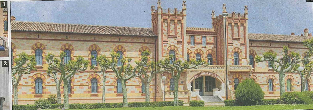
► L'HOTEL BALNEARI VICHY CATALAN està situat a la vila termal de Caldes de Malavella. 1 La banyera d'una de les suites de l'hotel, amb molt bones vistes. 2 La Junior Suite de Vichy d'Or, estrenada en el darrer any. 3 La façana exterior del balneari. DdG