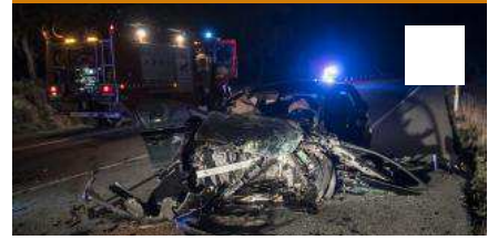
Accident mortal a la Jonquera