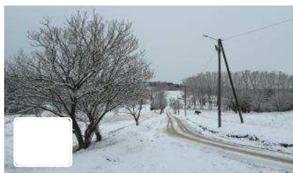
Nevada a cotes baixes de les comarques de Girona

A la resta de Catalunya, no consten cancel·lacions en les rutes escolars ni centres tancats com a conseqüència de la neu caiguda des de principis de setmana.