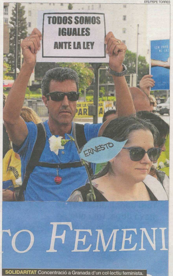
SOLIDARITAT Concentració a Granada d'un col·lectiu feminista.

Així que van conèixer l'acte, els lletrats de Rivas van presentar al Constitucional el recurs d'empara que va ser rebutjat fa unes setmanes, precisament fins que es produís un pronunciament de l'Audiència de Granada. En el recurs es demana, segons detalla l'agència Efe, que se suspengui l'execució de la