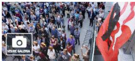
Caldes de Malavella, un poble «colpit» i «consternat» per la tragèdia del Mas Oller

Unes 300 persones van guardar un minut de silenci a, ahir al vespre, a Caldes de Malavella , en record de la nena de 6 anys que va perdre la vida diumenge passat en l'accident ocorregut en el castell inflable instal·lat en el jardí del restaurant Mas Oller. La convocatòria es va fer per transmetre l'escalf de la població als sis infants ferits de diversa consideració i als familiars de la víctima mortal, veïna de Tordera, al Maresme.