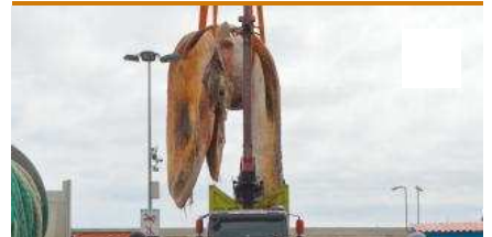
Extracció de la balena morta a Blanes