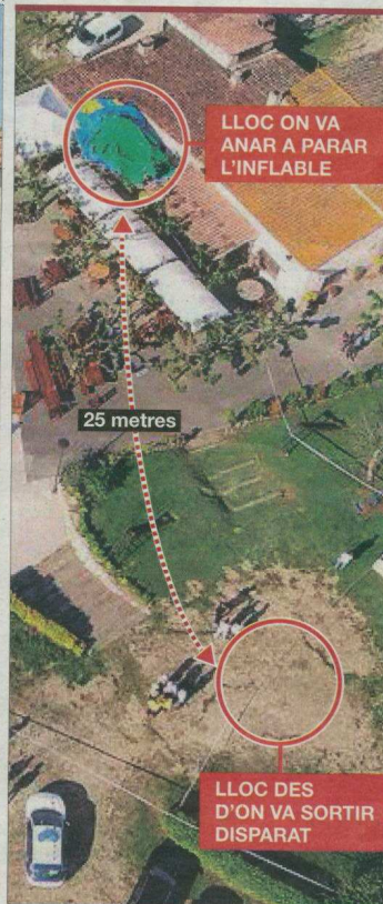
► Agents dels Mossos d'Esquadra al jardí del restaurant de Caldes de Malavella on va morir ahir una nena.