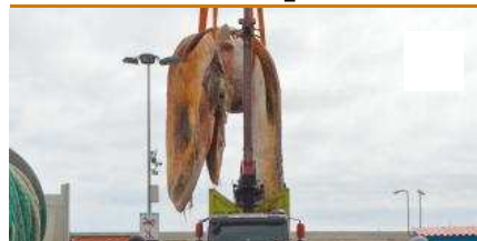
Extracció de la balena morta a Blanes