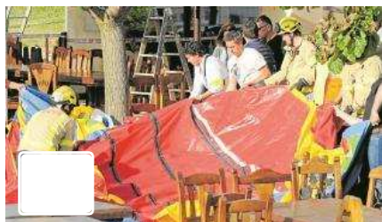
El castell inflable de Caldes tenia una cremallera oberta

El castell inflable de Caldes de Malavella tenia una de les cremalleres oberta. Es tractaria, per tant, d'una irregularitat que se sumaria al mal ancoratge d'aquesta atracció, que funcionava al restaurant Mas Oller sense tenir cap permís municipal. De moment, els Mossos d'Esquadra han sumat aquest nou element al seu atestat, que apunta que almenys hi havia un mal muntatge de l'atracció. Segons va avançar ahir La Vanguardia i va confirmar Diari de Girona, una de les dues cremalleres estava oberta, fet que podria haver provocat –entre altres elements– la tragèdia.