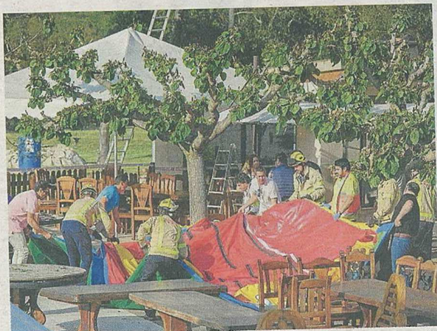
Encara hi ha ingressats tres dels nens ferits diumenge en l'accident al restaurant de Caldes de Malavella. DAVID BORRAT

L'advocat del propietari del restaurant diu que no és clar que calgués cap permís