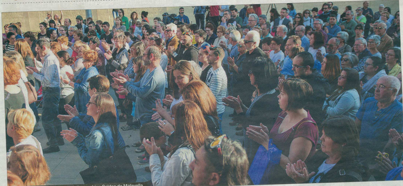
Concentració de suport a les víctimes, ahir a Caldes de Malavella.