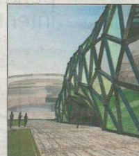
massís d'Arderya Cadiretes. Anys més tard, uns altres empresaris van proposar un gran parc temàtic relacionat amb els cavalls, però va quedar en no res. "Quan se'ls va

A Caldes de Malavella, a més d'un inversor se li va despertar l'instint empresarial, però pocs projectes han reeixit. El 2009 uns inversors russos van proposar a l'Ajuntament fer un parc temàtic de la pagesia. Inicialment els russos volien fer-lo de dinosaures, i tenien la masia ideal a Can Noguera. El consistori no va veure gaire clar això dels dinosaures, i es va acabar reconduint cap al tema agrícola. El Departament de Medi Ambient de la Generalitat, però, va posar-hi fre, ja que la zona està dins del PEIN del