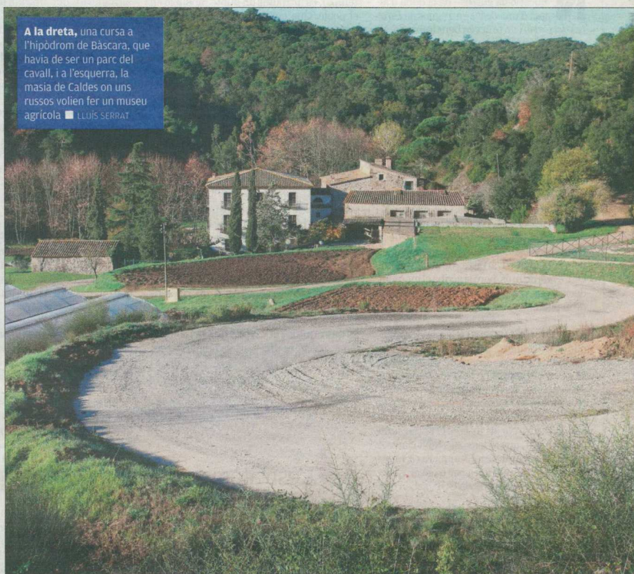
A la dreta, una cursa a l'hipòdrom de Bascara, que havia de ser un parc del cavall, i a l'esquerra, la masia de Caldes on uns russos volien fer un museu agrícola