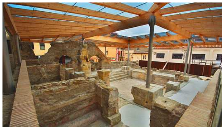
Caldes de Malavella

Caldes de Malavella pràcticament no conserva grans estructures urbanes com altres ciutats d'origen romà. Per tant, segurament Aquae Vocconis era un centre de salut. El municipi continua fidel als seus orígens: el seu principal patrimoni continua sent l'aigua que brolla a 60 graus. Hi ha tres empreses amb plantes embotelladores i dos balnearis que aprofiten les aigües termals. Se sap que hi havia dos balnearis en època romana: el Puig de les Ànimes i les termes de Puig de Sant Grau. De les primeres no en queda res; de les segones se n'han trobat diferents àmbits: hi ha dues galeries, que en època medieval van ser utilitzades com a hospital de pobres, i una piscina central envoltada de grades. Hi hauria també una cambra que tindria una funció religiosa. Moltes vegades es creia que el tractament curatiu arribava per mitjà de l'oracle dels déus. Els seus missatges s'escollaven durant els somnis, en un estat de semiinconsciència. La majoria d'altars que s'hi han localitzats són de famílies veïnes. Sigui com sigui, com molts altres balnearis, és gràcies a les aigües termals que al seu entorn s'hi construeixen vies i creixen diferents pobles que ofereixen serveis als que busquen guarir-se.