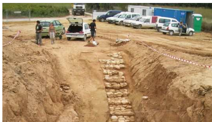
Pou de Montargull