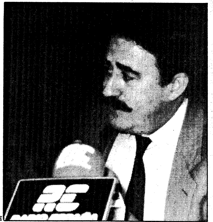
Carlos Romero, ministro de Agricultura

Carlos Romero dijo que su gran empeño ha sido resolver los problemas específicos de la agricultura española durante la presidencia griega y que así se había conseguido desbloquear nuestras exportaciones de porcino a la Comunidad, aunque quedó pendiente la reforma sobre leguminosas y frutos secos, que será tratado en los primeros días del mes de enero: «Para desbloquear estos temas, como la carne de bovino, manten-