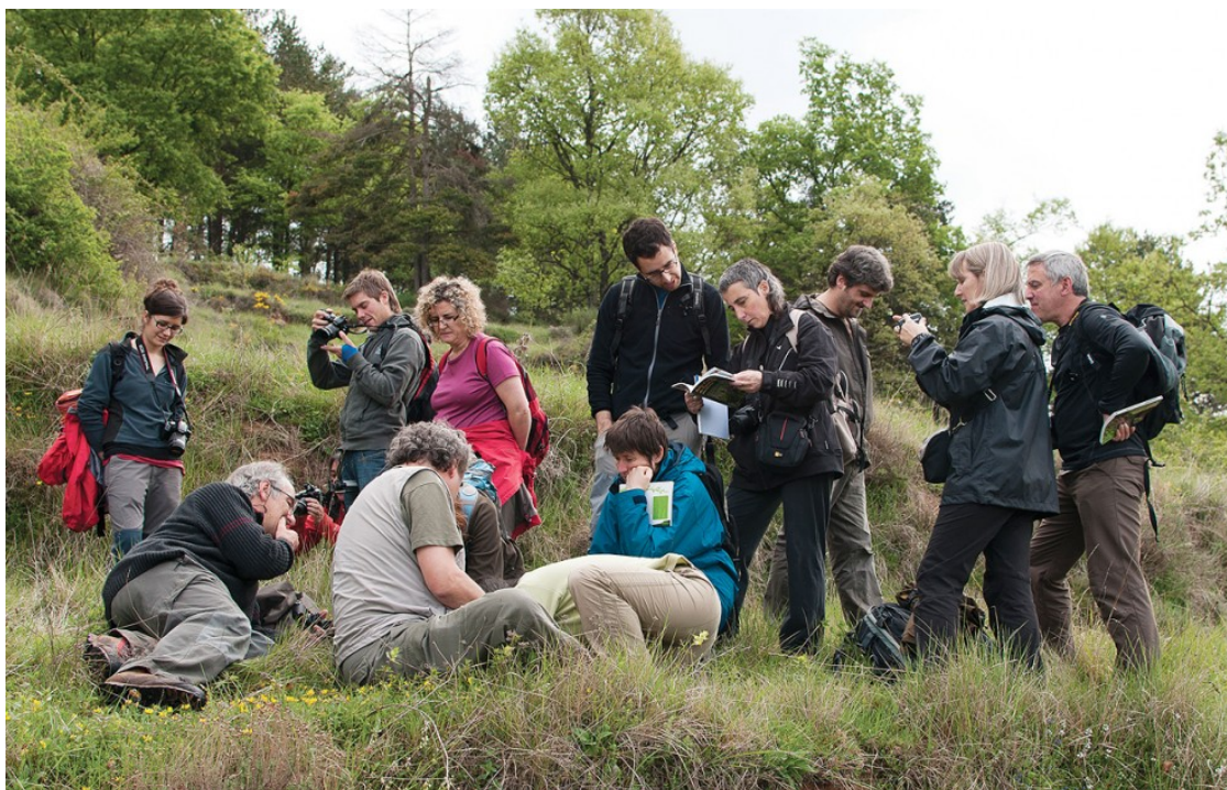
Integrants del Grup d'Orquídiess del Ripollès | Marc Cargol

Quaranta persones han participat en una obra editada per la Institució Catalana d'Història Natural | La recerca va començar