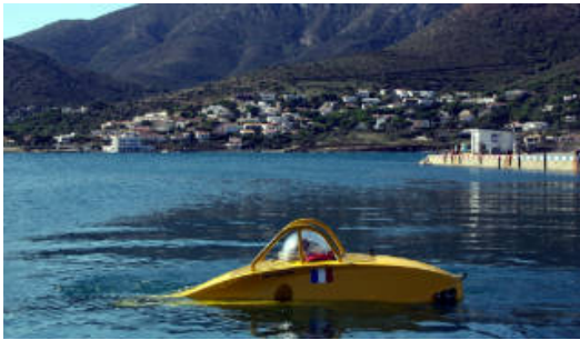
L'Ictineu 3 "obre noves fronteres" en l'arqueologia submarina

Capaç de baixar a una profunditat de 1.200 metres, el submergible ha realitzat aquest mes de setembre la seva primera campanya al jaciment de Cala Cativa I, al Port de la Selva