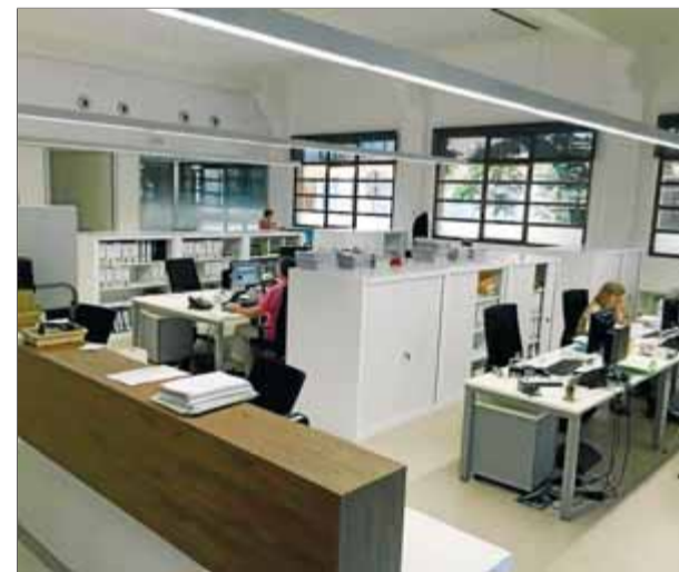
Interior de les noves dependències de l'ajuntament de Salt, a l'espai que ocupava la Policia Municipal ■ J.N.

A més de l'exposició, de fotos antigues de l'Arxiu i la vila, i mostres de documents, els visitants podran veure els diferents dipòsits de documentació, que no són d'accés per al públic en general, i alguns dels documents més antics i curiosos del patrimoni documental saltenc. Actualment, l'Arxiu ocupa una de les antigues naus Guixeres, de 600 m 2 . ■