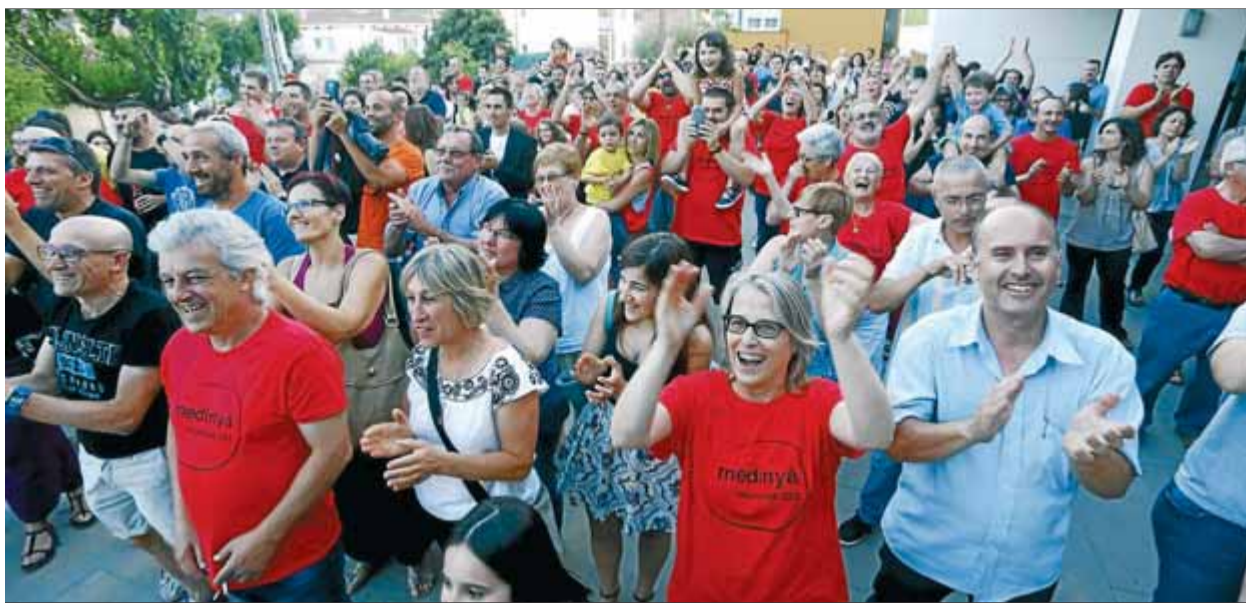
Veïns de Medinyà celebrant l'aprovació de la llei de segregació el 4 de juny passat