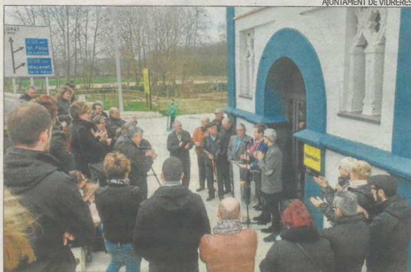
Inauguració de l'Escorxador, que serà una oficina de turisme i de promoció.