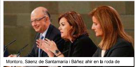
Montoro, Sáenz de Santamaría i Báñez ahir en la roda de