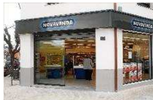
Novavenda reobre una botiga a Caldes després d' ampliar-la carles colomer

La cadena de supermercats Novavenda va reobrir ahir el seu establiment de Caldes de Malavella després d'ampliar-lo, reformar-lo i renovar la maquinària industrial. El local, de 600 metres quadrats, dona feina a 8 empleats, a més dels 5 que ocupa la carnisseria de Jesús Turón situada al seu interior. Novavenda compta en l'actualitat amb 16 establiments propis i 13 d'associats. caldes de malavella | dgd