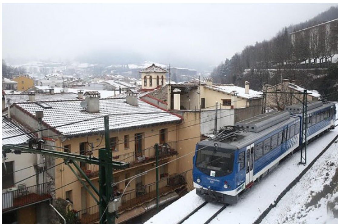
El cremallera passant per un Ribes de Freser ben nevat.

Fotos de la nevada al Ripollès