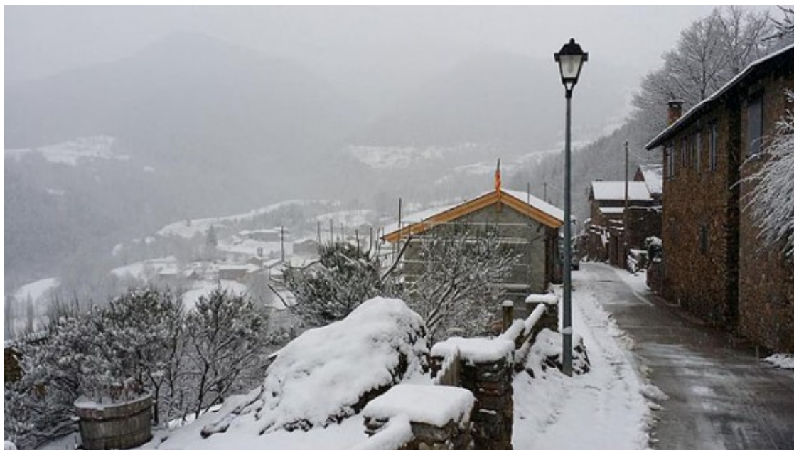
A Nevà s'acumulen 5 centímetres (9.15).