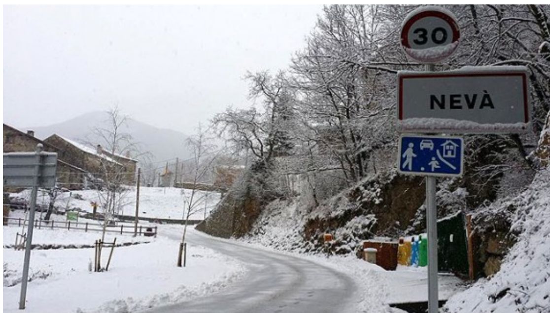
Nevada a Nevà.