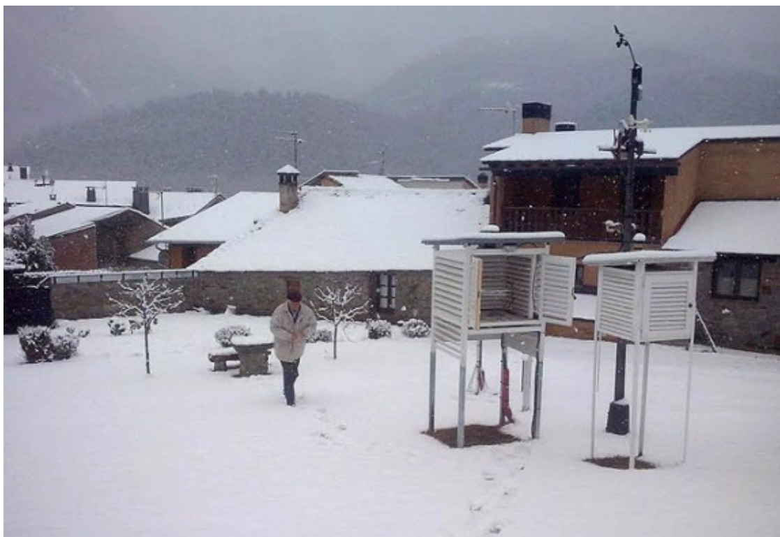
A Planoles s'acumulen 6 centímetres (11.03).