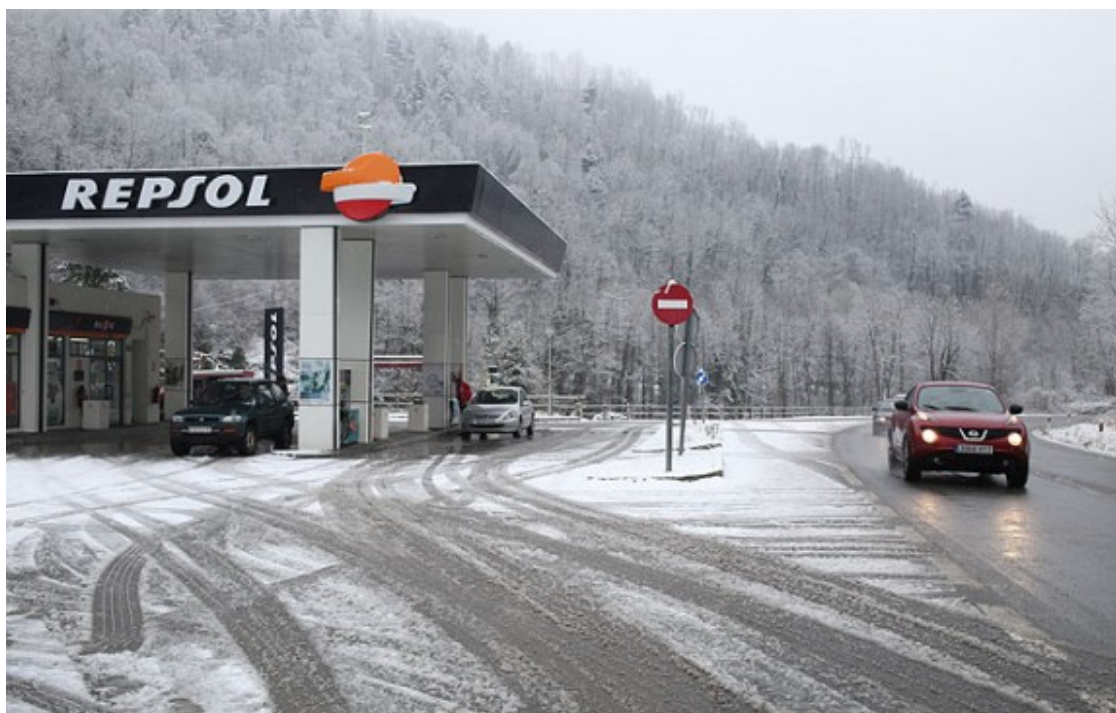
Neu a la benzinera de Campelles, a la N-260