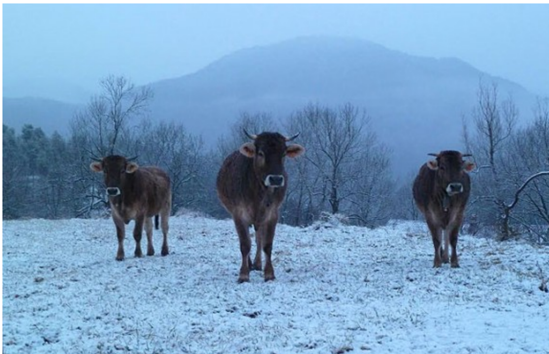
Vaques amb neu a l'entorn de Ripoll.