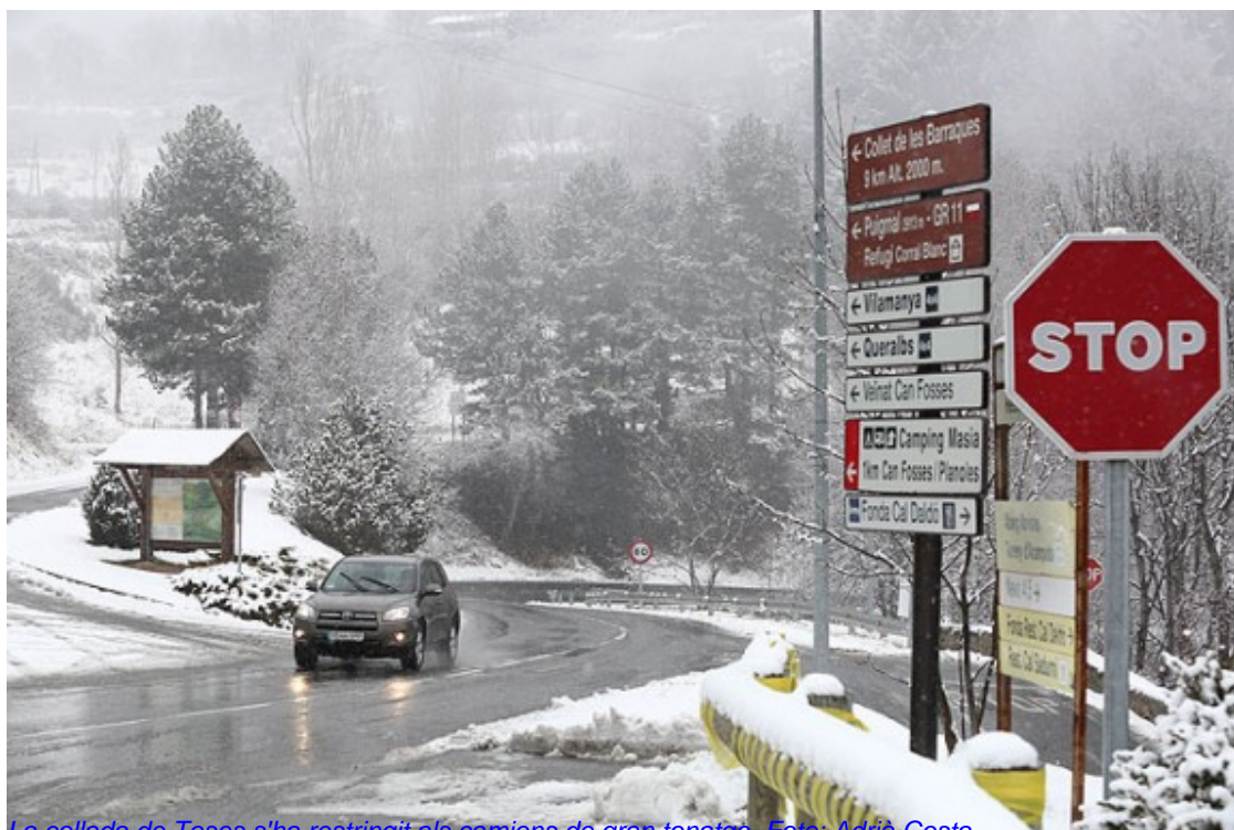
La collada de Toses s'ha restringit als camions de gran tonatge.