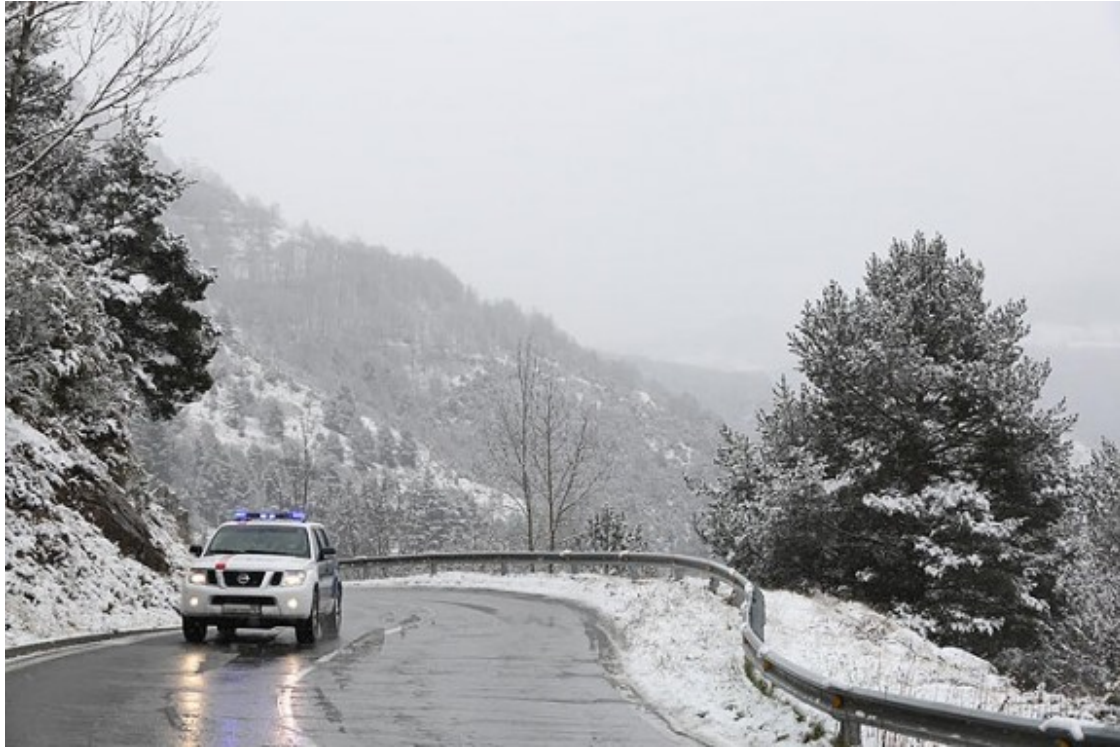
La nevada ha deixat uns 5 cm a Planoles.

Incidències de trànsi (Servei Català del Trànsit)