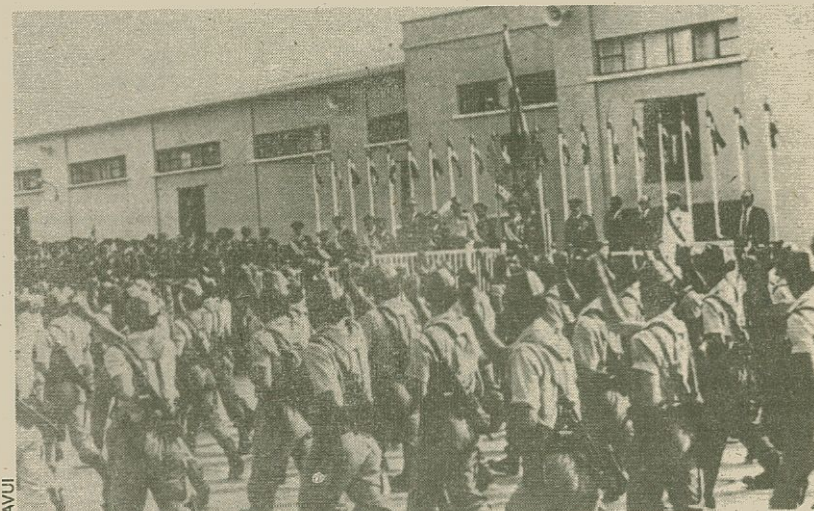
Els legionaris de la classe de tropa que vulguin ser suboficials passaran per l'Acadèmia de Talarn a partir de l'any vinent

L'Acadèmia de Suboficials a Talarn ha estat la causa que en diverses ocasions hi hagi hagut aldarulls entre militars i joves nacionalistes de la població. En alguns casos han acabat amb ferits lleus i amb sentències judicials. Tot i així, les autoritats civils i militars de Tremp —capital del Pallars Jussà, que és a pocs quilòmetres de Talarn— han coincidit sempre a destacar el bon