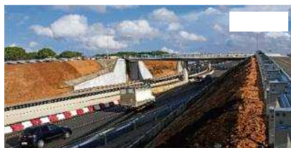
El tram desdoblada de la N-II entre Caldes i Sils, en una imatge de fa pocs dies. CARLES COLOMER

L'Estat finalment ha posat data a l'entrada en funcionament del desdoblament de la N-II entre Caldes de Malavella i Sils, un dels territoris de les comarques gironines que arrossega més greuges del projecte per convertir la carretera en autovia. En aquest tram, de 6,6 quilòmetres, les obres van començar el 2007, en el segon mandat del PSOE, i el Govern del PP ha posat el punt final amb un altre retard.