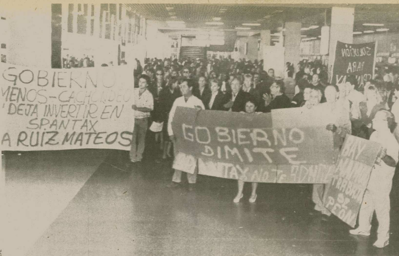
Els empleats de Spantax de Las Palmas es manifesten a l'aeroport de Gran Canària reclamant els seus llocs de treball