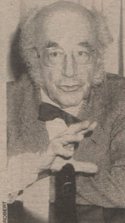
Giorgio Fuà, economista italià