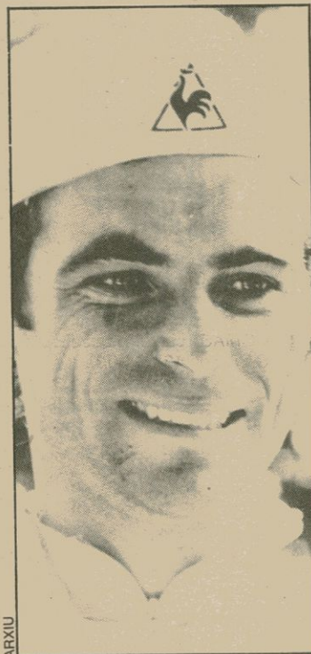
El francès Bernard Hinault

Després d'un començament de temporada en què semblava marcar el seu declivi, amb constants abandonaments i resultats dolents, Hinault, que ara té