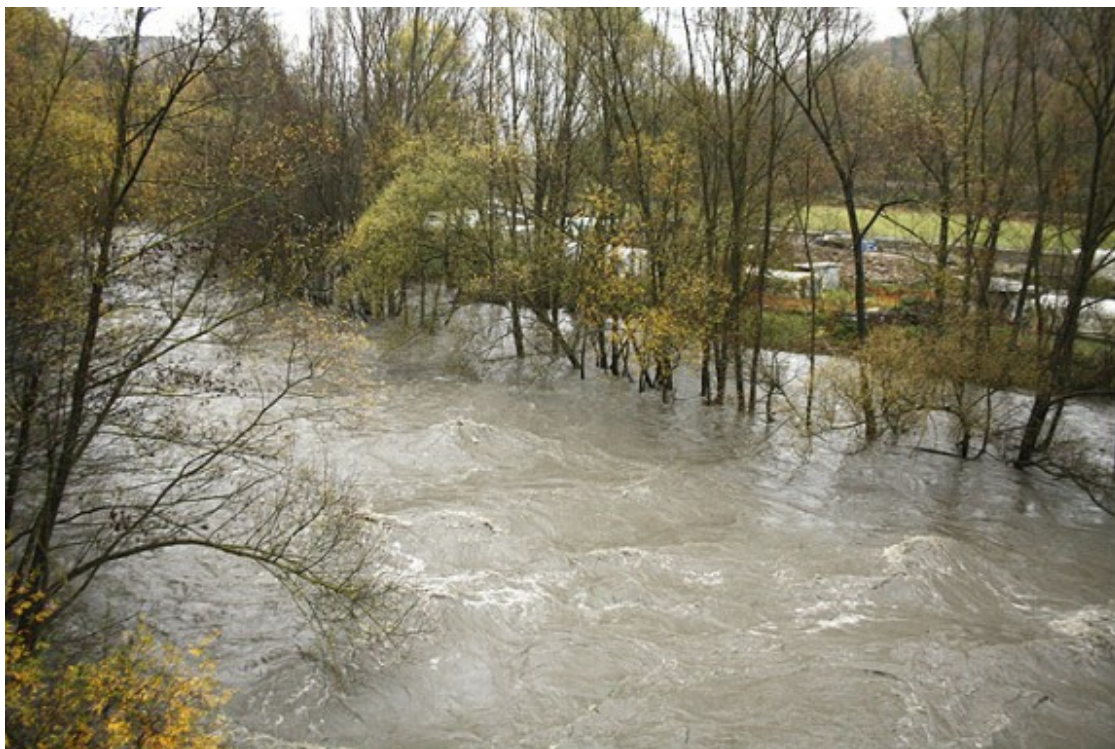
El cabal del Ter a Ripoll, dissabte a la tarda.