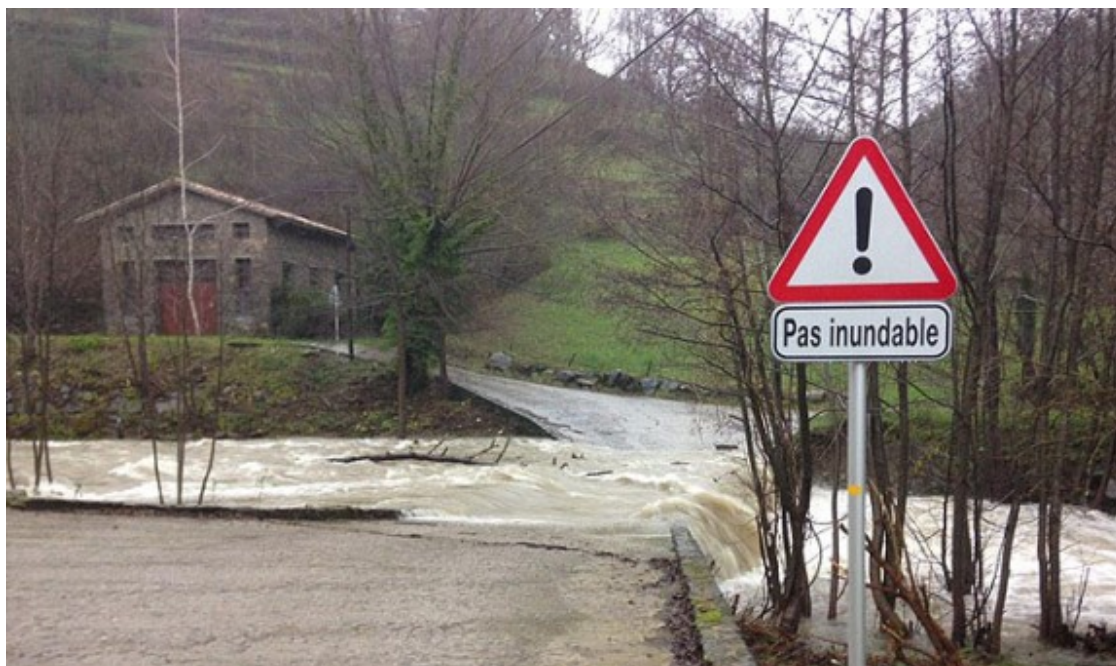
Un camí veïnal de Molló, tallat per la força del riu Ritort.

Aquest dilluns el temps no acabarà de fer net i no es descarten quatre gotes al llarg de la jornada. El temps millorarà a mesura que avanci la setmana amb unes temperatures que aniran a la baixa i acabaran pràcticament amb fred prehivernal.