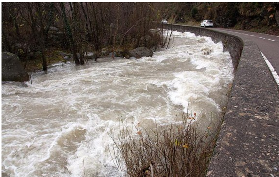
El Freser, entre Ribes i Queralbs aquest diumenge.

Principals incidències de la llevantada al Ripollès