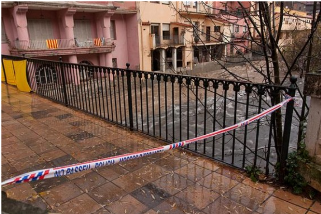
El Freser a Ribes, amb menys cabal aquest diumenge al matí.