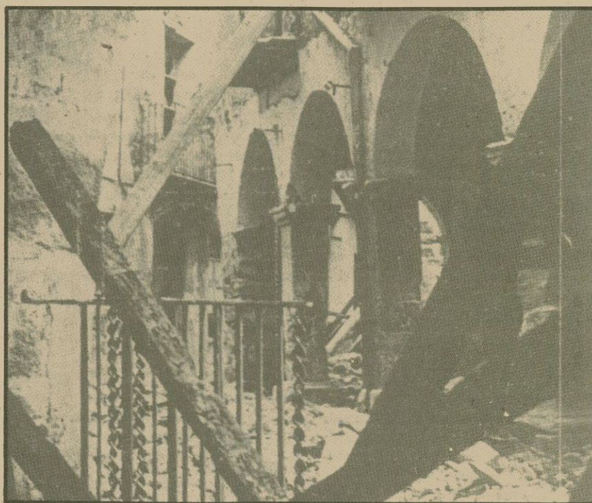
El temps i les vicissituds havien enderrocat els coberts del Cal Curià, a Agramunt. Ara, la vila es disposa a reconstruir la casa

Tothom dient: no ho sé, no ho sé. I algú va dir: L'única que ho pot saber és una senyora vella que rentava la roba dels ferits. Només va caldre que diguessin això perquè enviessin a la meva àvia un paper dient que es presentés a la guàrdia civil.