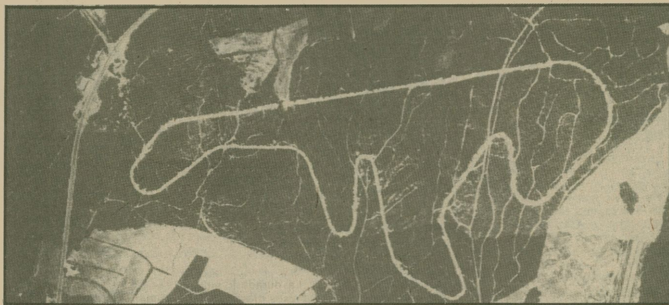
La foto aèria del circuit permet de veure l'autopista a l'esquerra, la N-II a la dreta i el camí ral de Girona a Barcelona que travessa el circuit pel mig

A les planes esportives de l'AVUI han sortit en diverses ocasions algunes informacions sobre el circuit de Caldes de Malavella. El 20 de gener del 1979 s'hi va publicar, a més, una foto aèria del circuit on es veia l'itinerari de les curses. S'hi havia desbrossat en una amplària de cinc metres, tot i que el traçat definitiu n'ha de tenir vint-i-un, per tal de fer-hi vorapistes i carreteres laterals per als serveis d'ambulàncies, bombers, etc.