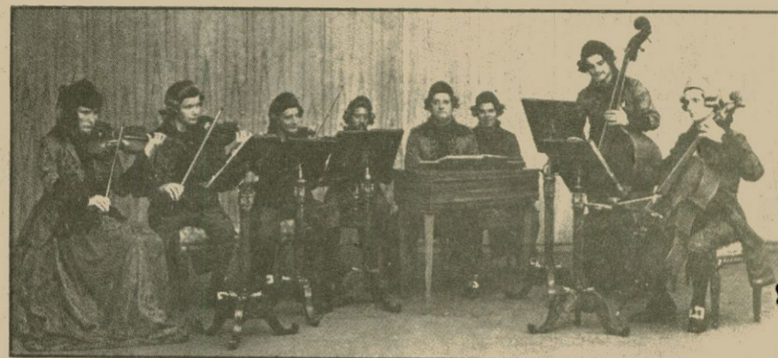
El Musicae Antiquae Collegium Varsoviense, protagonista de la setmana musical