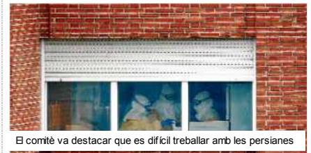
El comitè va destacar que es difícil treballar amb les persianes