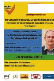
El cartell anunciador.