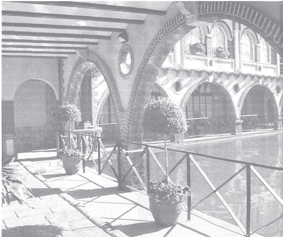
De construcció recent, les Termes Montbrí, a Montbrí del Camp, van ser l'escenari del rodatge de la sèrie de TV3 Dones d'aigua.