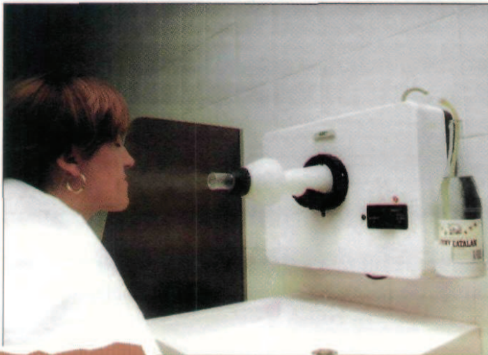
De dalt a baix, una sessió de dutxa massatge, la piscina termal amb coixí de bombolles i un aparell per a inhalacions d'aigua polvoritzada en ple funcionament.

aquest cas— situada a certa distància de la regió que es troba afectada).