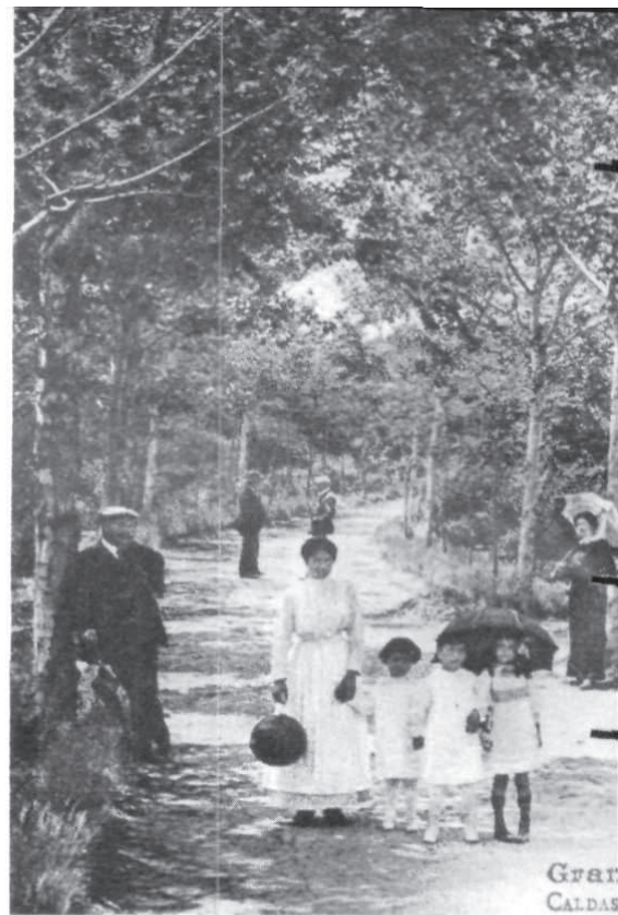
Personatges com el mateix Rusiñó tan de moda entre la societat

Fora de l'espai balneari, la vila de Caldes, per mimetisme, s'adequava per ésser una continuació dels establiments termals i generava nous espais