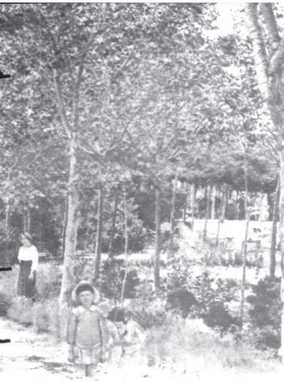
Balneario VICHY CATALAN DE MATAVELLA (Girona). 15. - Parque es passejaren per aquests indrets, ciutat benestant catalana.

la ciutat de Barcelona durant els pri- mers anys de segle.