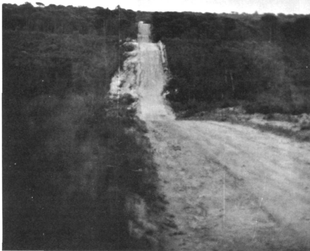
Carretera oberta pel R.A.C.C. prop de la N-II, en el terme municipal de Caldes de Malavella.

L'únic coneixement de com serà el circuit, que posseeix actualment l'Ajuntament, procedeix de les explicacions donades per part dels redactors de l'avantprojecte —si bé aquest en concret tampoc no s'ha vist— i d'una pel·lícula de propaganda que ens passaren el passat dia 12, que presenta una sèrie de dibuixos molt ben fets, molt comercials, però absolutament inconcrets. Per tot això, ens refermem en la nostra voluntat de col·laboració, sempre que es respectin unes normes de salvaguarda del patrimoni comú, no degradant l'entorn, i que al mateix temps la instal·lació del circuit no causi problemes a la Vila. Lamentem profundament les notícies contradictòries i a vegades tendencioses que s'han publicat, i preguem que, en cas de requerir qualsevol informació, es dirigeixin a l'oficina de l'Ajuntament, Conselleria de Relacions Públiques.