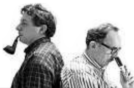
Josep Maria Pasqual / Jordi Soler

dels orcs, bel·licosos insaciables, es van destruir entre si mateixos alhora que feien caure les civilitzacions més poderoses. L'aspecte dels orcs és semblant al dels humans, però tocat per una llejor indescriptible. Tenen la mandíbula inferior prominent i els ullals exageradament llargaruts. De costums carnívors, els orcs es cruseixen les sobres abandonades pels animals salvatges encara que estiguin en estat avançat de podridura i, si convé, practiquen el canibalisme amb els cadàvers vençuts dels seus adversaris, ja siguin forasters o compatriotes. Els principals enemics dels orcs són els elfs, una espècie semblant.