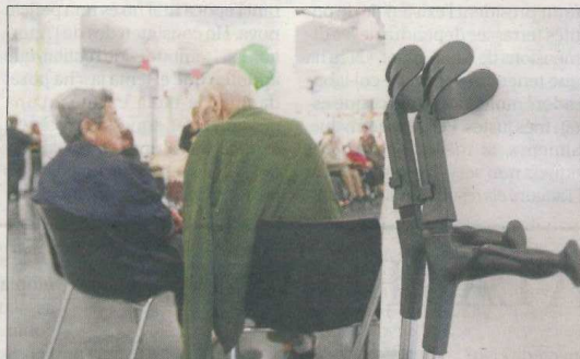
L'edat condiciona el serveis públics que ofereixen els ajuntaments.