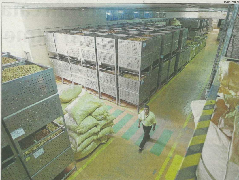
Instal·lacions de la companyia a Caldes.

Fundada l'any 1871, el grup compta amb filials als Estats Units, Sud-àfrica, França, Xile i Argentina.