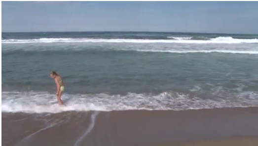
S'ofega un home a Torroella

Dos banyistes que eren a la zona el van aconseguir treure de l'aigua i van intentar reanimar-lo