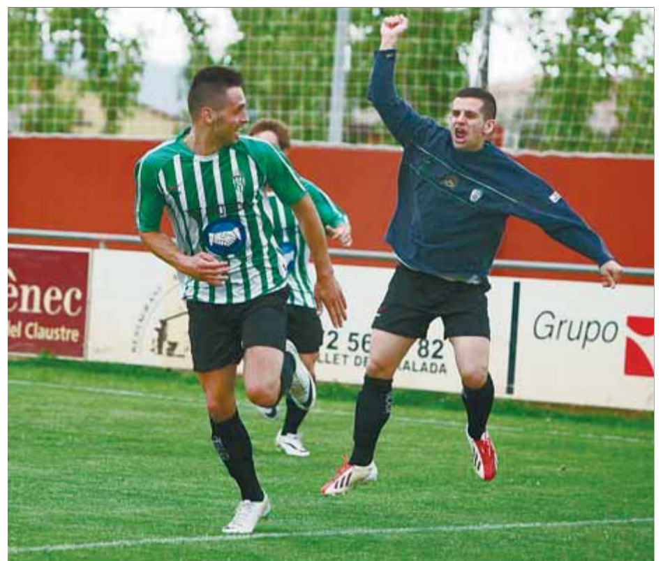
Dos jugadors del Peralada celebren un gol durant un matx d'aquesta campanya

1a catalana. Els empordanesos poden ser equip de tercera diumenge després d'una temporada històrica